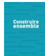
Le MOOC sur les partenariats

Un MOOC pour se former : L'ESSEC et Le RAMEAU vous proposent sur Coursera.org le MOOC « les partenariats qui changent le monde ». Il éclaire sur les différents types de partenariats associations-entreprises, leurs objectifs, conditions de déploiement et évaluation. Ce MOOC est construit autour de 4 séances de 2h, articulant des témoignages de praticiens, le regard d'experts , des vidéos de synthèse des enseignements, des quizz et des outils pratiques.