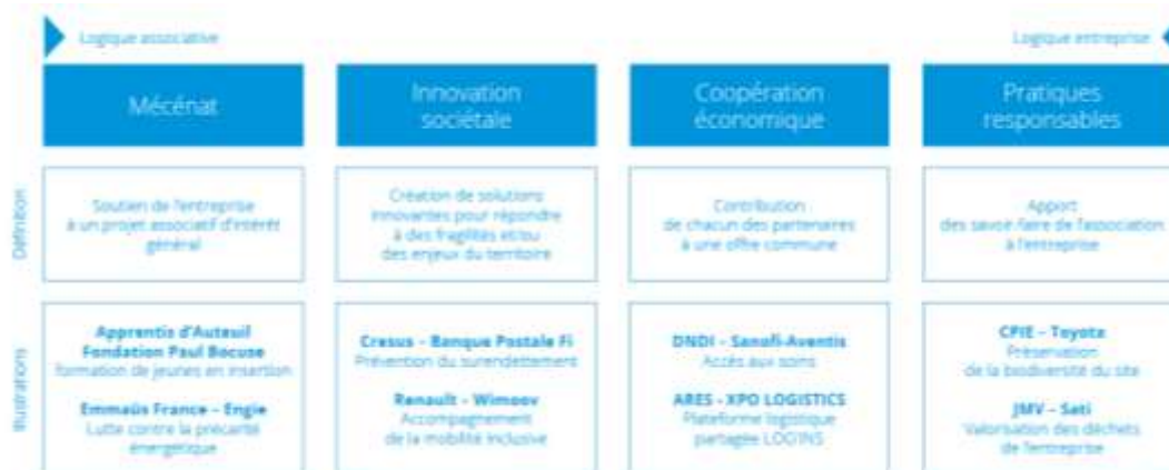
LES QUATRE CATEGORIES DE PARTENARIAT ASSOCIANT INTERET GENERAL & ACTEURS ECONOMIQUES

Actuellement en France, les partenariats les plus courants relèvent des pratiques responsables et du mécénat. La coopération économique est en pleine expansion, et quelques pionniers se sont d'ores et déjà engagés sur la voie d'alliances d'innovation sociale. Ces deux derniers modes relationnels sont encore plus courants à l'international.